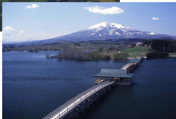
廻堰大溜池と岩木山