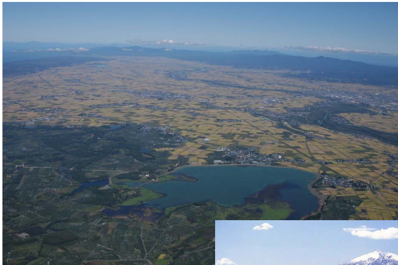
上流からの西津軽地区