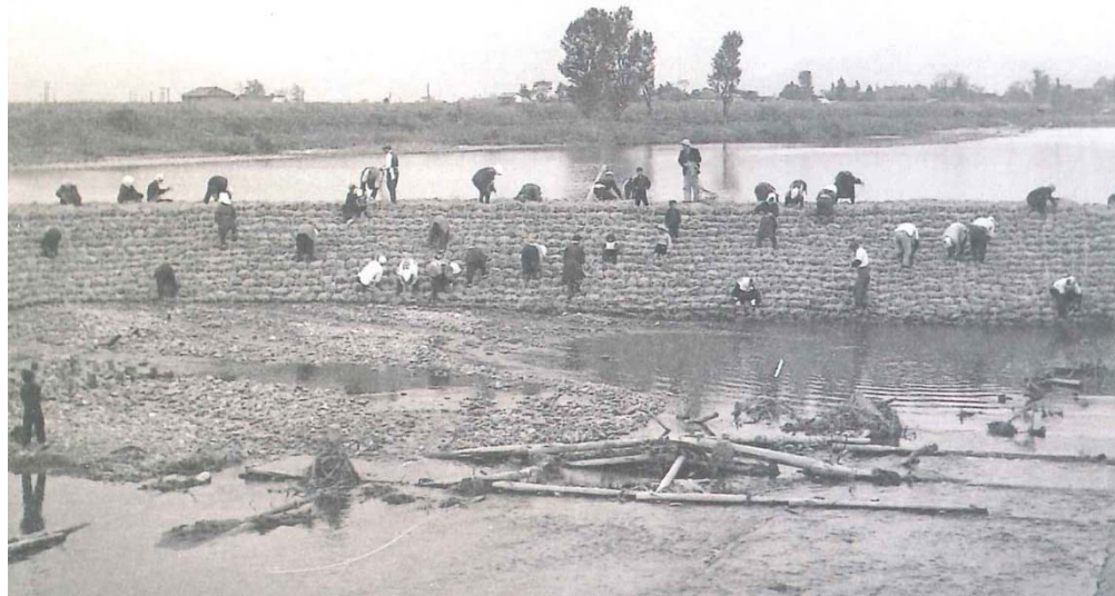
昭和33年以前の土淵堰補修状況（俵積み作業）