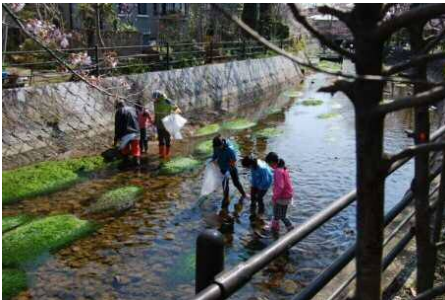
内川ふるさと保全隊による清掃活動