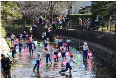
内川の生き物調査をする地元の小学生