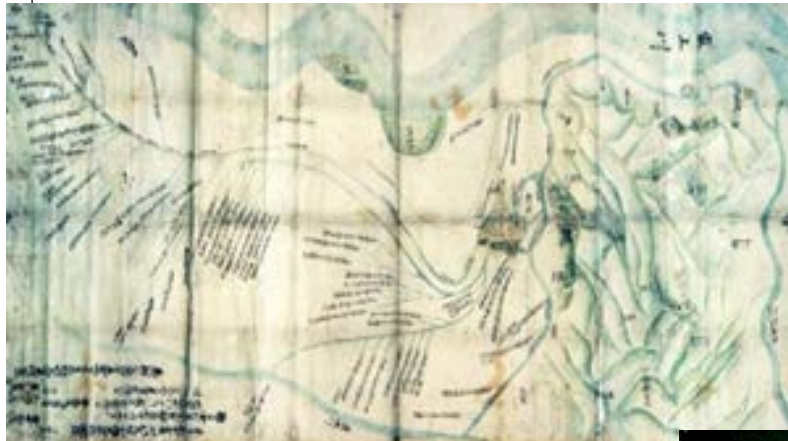
1655年 狩川大堰（北楯大堰）絵図