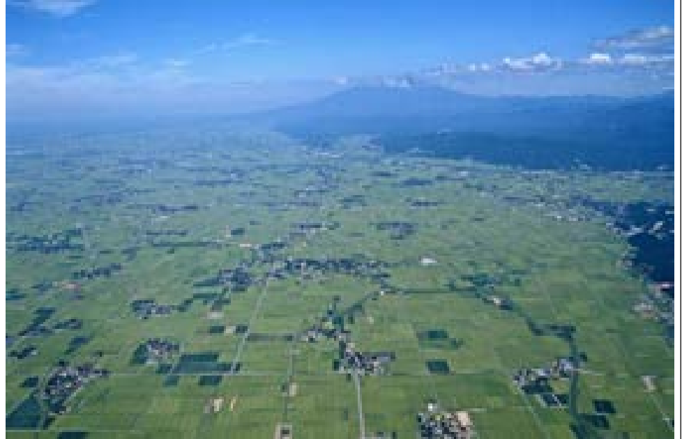
米どころ庄内平野