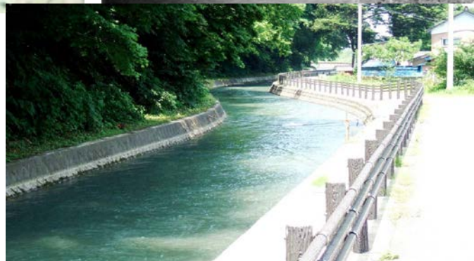
昭和初期（上）と現在（下）の北楯大堰