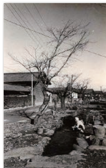
昔の雄川堰で 洗いものをする人