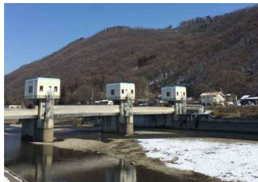
奈良井川から取水する拾ヶ堰頭首工