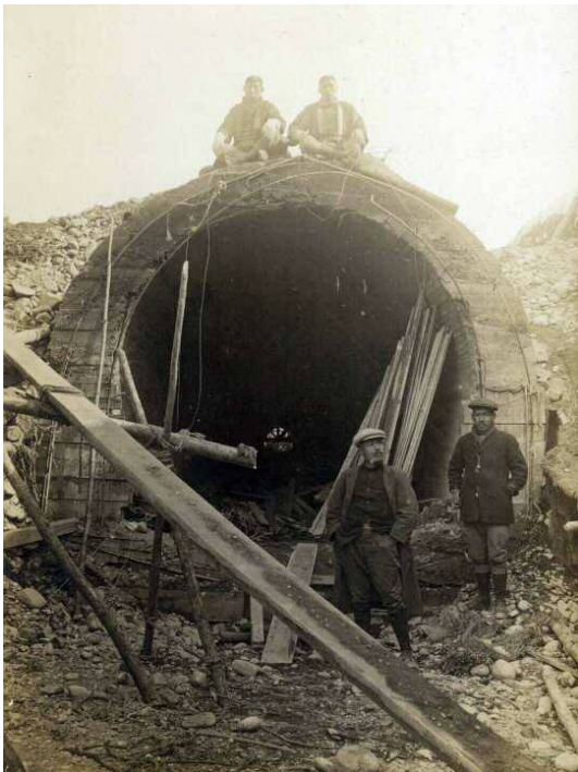
河川横断部を平面横断からサイフォンに改修した当時の写真（大正9年）