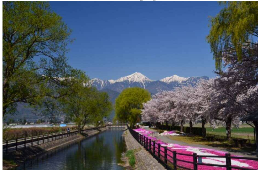
散歩やサイクリングなど、憩いの場としても活用される拾ヶ堰

■約1/3000の緩勾配で河川や多くの既設水路を横断し、漏水や沈下対策として綿や稲わらをクッション材に使用するなど、現代の水路補修にも通じる様々な先進的技術を採用。