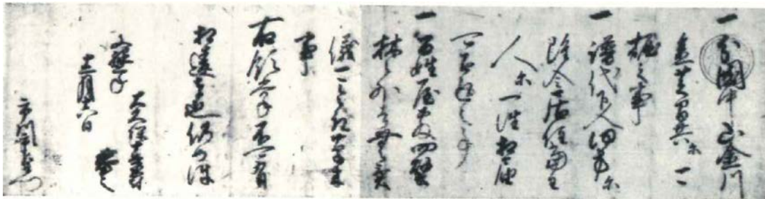
1593年、徳川家康から市川家にあてた「朱印状」