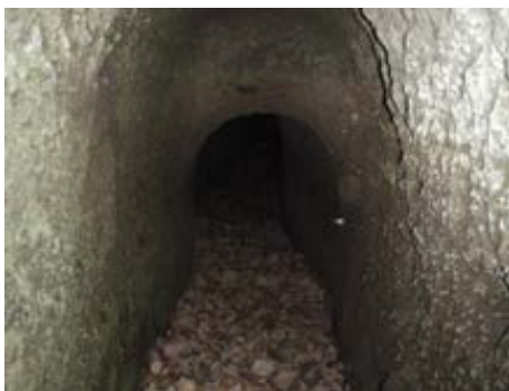
旧堀貫（トンネル） 鉱山開発のノウハウが 活かされた