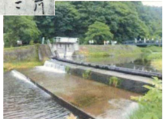
現在の五郎兵衛用水の頭首工