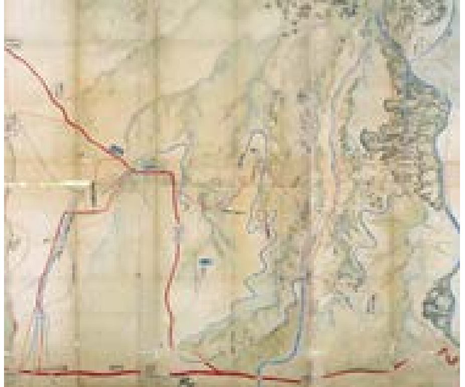
開削当時の水路絵図（1712年頃）