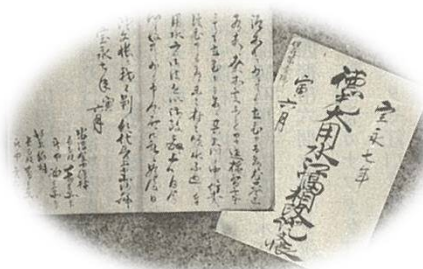
徳光大用水江幅相改証文帳