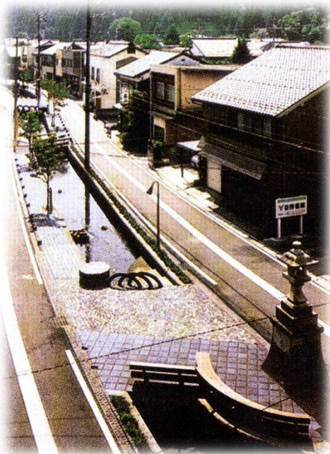
両脇の街道とともに用水が流れる町並み