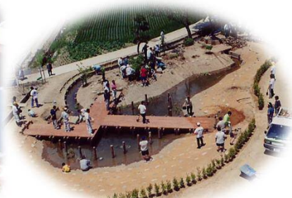
酒生わいわいトープ