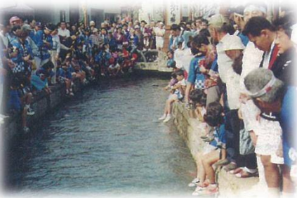
伝統行事のおつね祭り