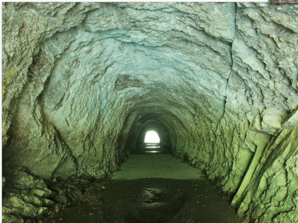
柳谷トンネル (素掘り隧道)