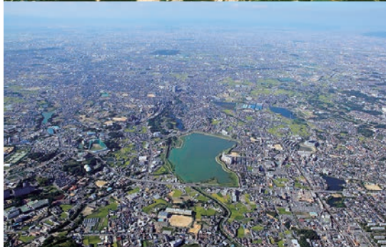
上：平成の改修前の狭山池（1998年） 下：平成の改修後の狭山池（2000年）