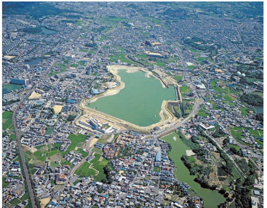
狭山池上空から水下を望む（2012年）