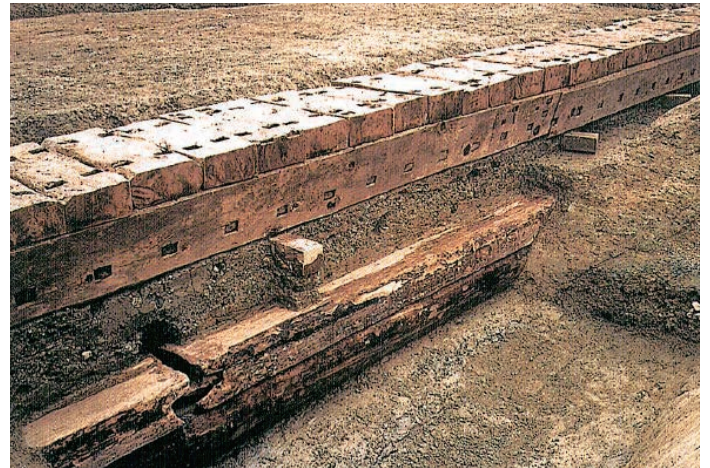
幾たびの改修の痕跡、 出土した木樋 (上：江戸時代 下：奈良時代)