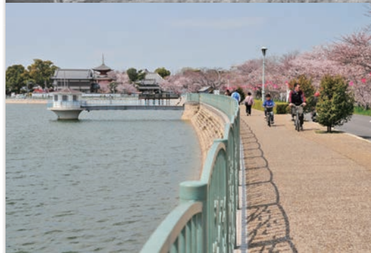
上：1965年ごろの久米田池の様子 下：現在の久米田池と久米田寺