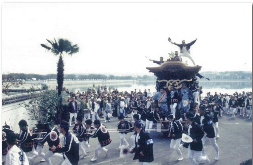
行基参り（10月だんじり祭）