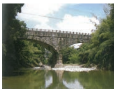
御坂サイフォン(めがね橋)