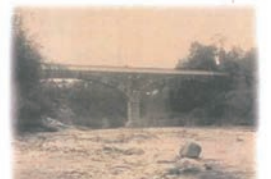
淡河川疏水御坂噴水管架載志染川弧石橋