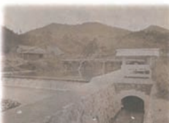
山田川疏水水源堰堤全景