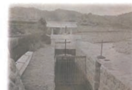
山田川疏水第一水門