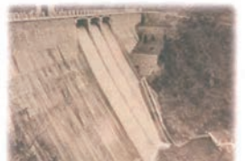
山田川疏水山田池堰堤