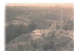
淡河川疏水御坂噴水管敷設