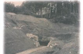
淡河川疏水二十番(芥子山)隧道鉄管入口