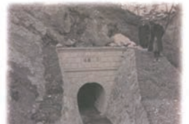
山田川疏水第二号隧道