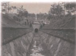
山田川疏水第十九号隧道口