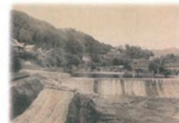
淡河川疏水水源石堰堤