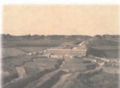
淡河川疏水練部屋排水閘