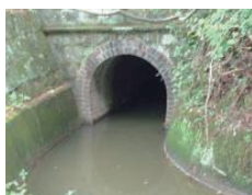
淡河幹線トンネル