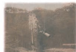
山田川疏水岩岡支線鉄管サイフォン