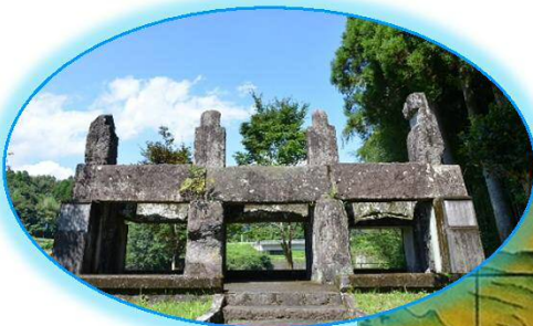
百太郎溝・旧取入樋門