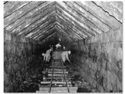
幸野溝・石合掌造り