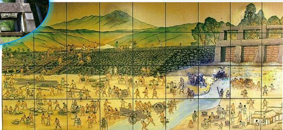
百太郎溝・大堰構想図