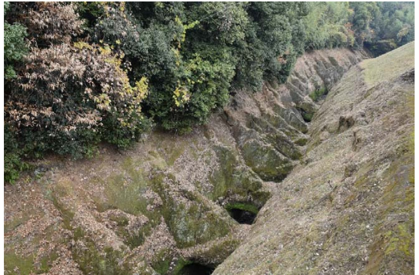
土砂堆積抑制の機能を持つ「鼻ぐり井手」（馬場楠井手用水）