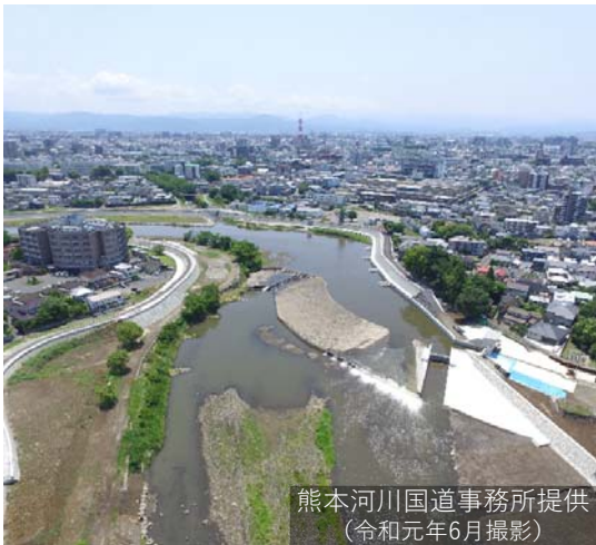
(令和元年6月撮影)

■ 当時の最先端技術によるこれら施設は、地域の自主的な維持管理もあって、度重なる災害にもかかわらず、機能を失うことなく現在も利用されている。