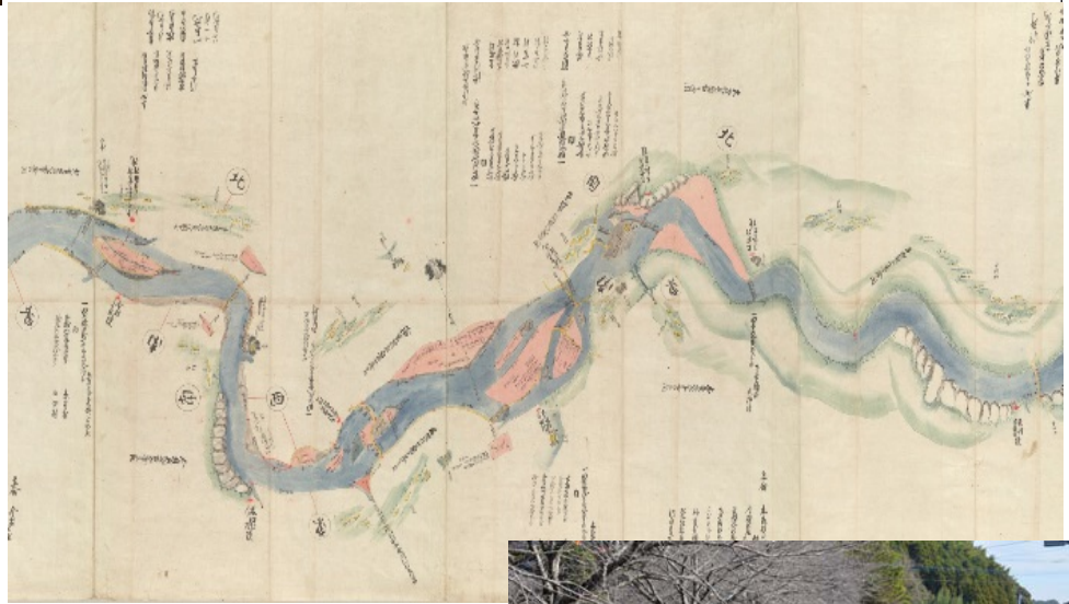
「菊池川全図」の築地井手部分