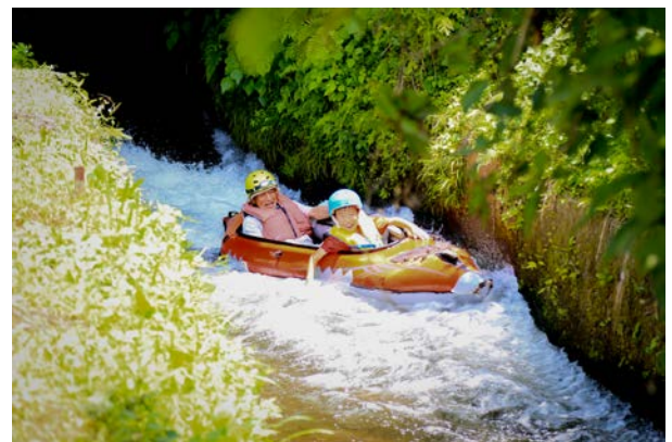
原井手下り「イデベンチャー」