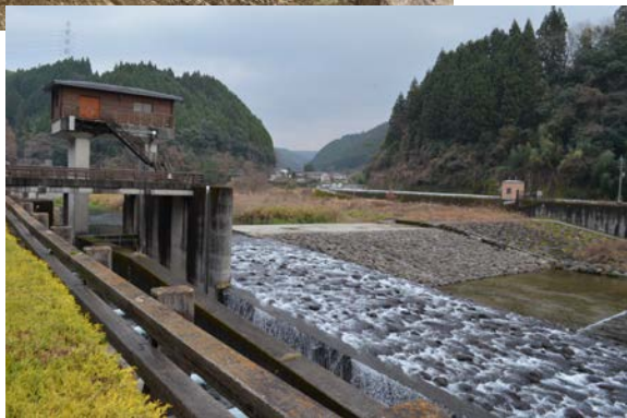
古川兵戸井手 取水部