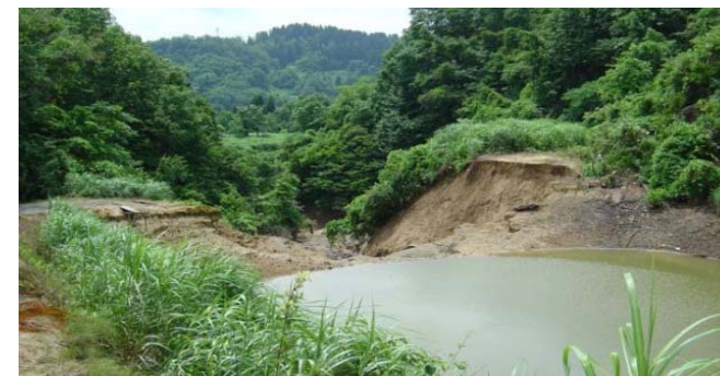
気候変動による将来の豪雨等への適応