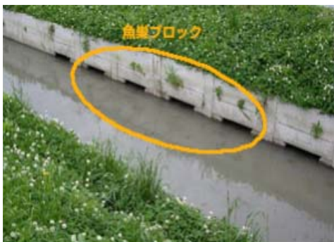
魚類の生息環境創造 (魚巣ブロック)