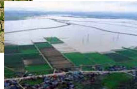
降水量の増加による影響