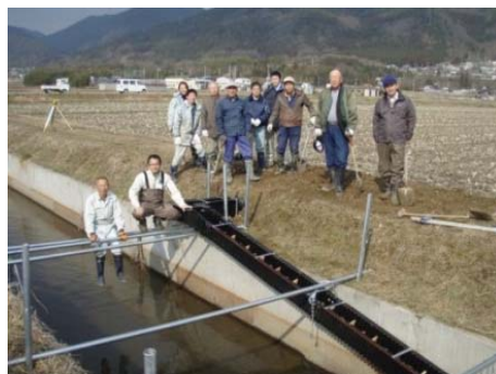
水田・水路間のネットワーク (水田魚道)