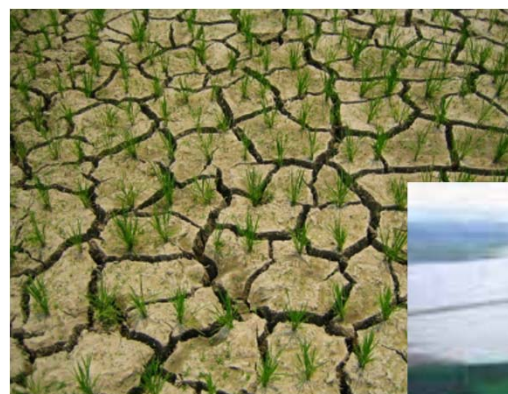
気温の上昇・降水量の減少による影響