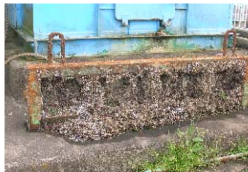
特定外来生物カワヒバリガイ による施設被害への対応