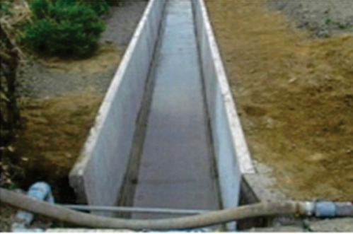
排水路の補修・更新等

田んぼダムの取組を行う流域治水プロジェクトの流域内における農業用排水施設の補修・更新等 (多面的機能支払交付金の枠組みを活用)