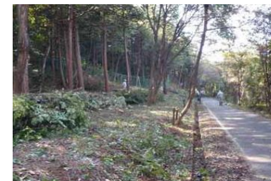
鳥獣緩衝帯（イメージ）

※1 鳥獣被害防止特措法に基づき、市町村が策定する鳥獣被害防止計画に基づく活動の中で設置されたもの等