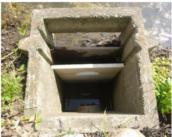
流出を抑制する落水量調整装置の例

「田んぼダム」とは、大雨時に河川や水路の水位の急上昇を抑えることで下流域の湛水被害リスクを低減させることを目的に、水田の落水口に流出量を抑制するための排水調整板を設置する等して雨水貯留能力を人為的に高める取組。