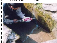
水路のひび割れ補修