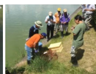
ため池の外來種駆除

実施主体：農業者等で構成される組織（①及び③は農業者のみで構成する組織でも取組可能） 対象農用地：農振農用地及び多面的機能の発揮の観点から都道府県知事が定める農用地