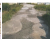
農道の窪みの補修