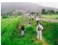
農地法面の草刈り