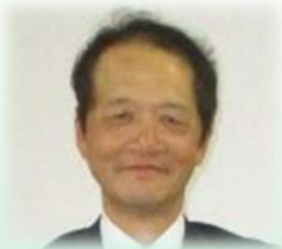
様々な資格を有する 事務局長