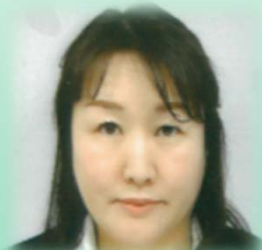
いつも明るいういゝドメカー