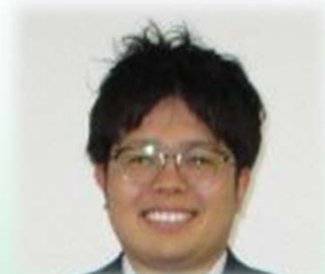
仕事も恋も一生懸命 主事