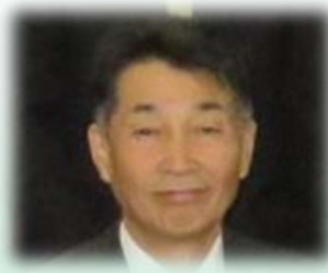
冷静沈着頼りになる 参事