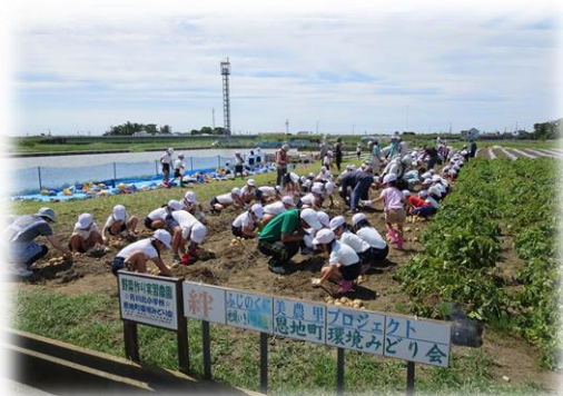
子供たちによるジャガイモ栽培体験