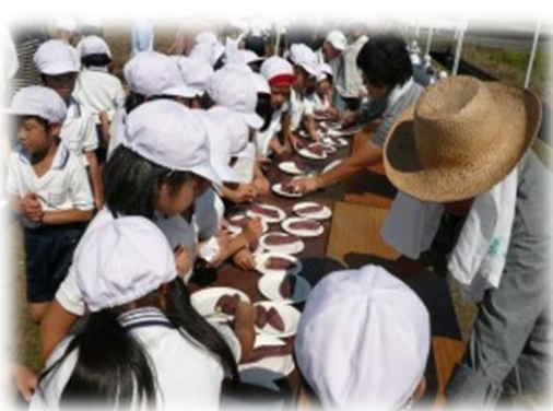
収穫したサツマイモを味わう