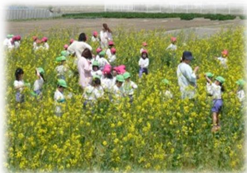
菜の花による「花いっぱい運動」