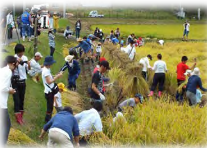
農業体験ふれあい祭り