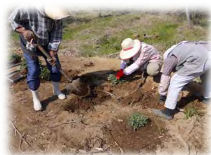
吸蜜用のノアザミ植栽