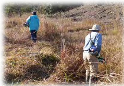
希少種生息地の草刈り