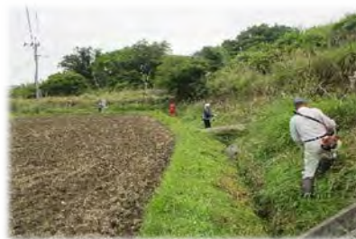
水路周辺の草刈り

◎今後は、地区全体の問題である高齢化・過疎化による人手不足の問題に対して地区全体で取り組んでいく為の体制づくりを進めるとともに、地域内外の人との交流を通じた地域の活性化を図っていきます。