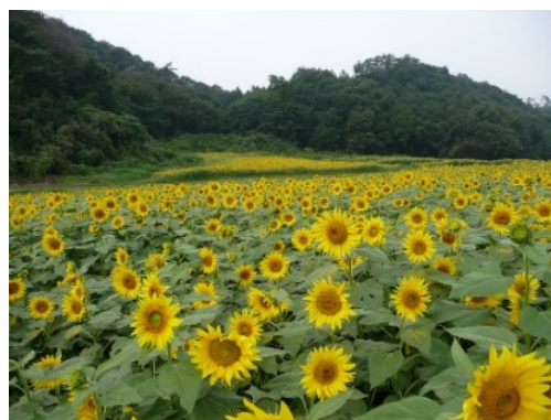
遊休農地となっていた農地 を活用したヒマワリの植栽