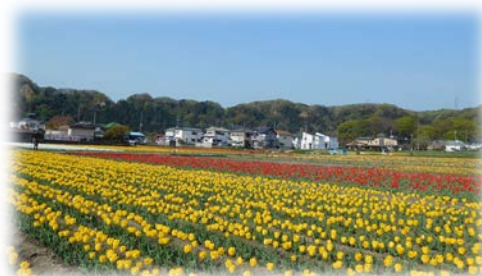
植栽したチューリップ