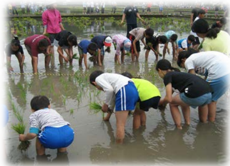
子ども達の農業体験