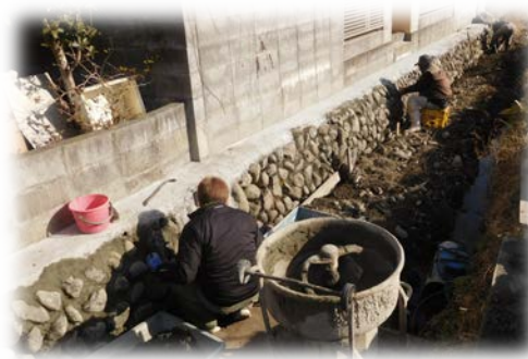
水路の石垣の修繕