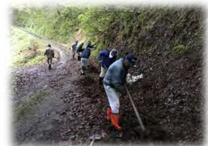
農道側溝の泥さらい ※選手が撮影