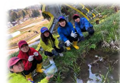
生き物調査の様子