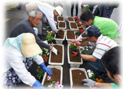
景観形成活動の様子