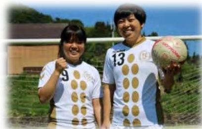
事務作業を担う FC 越後妻有の選手

彼女らは、「地域を上げて応援してもらえる選手になれるよう、組織の一員のつもりで一緒に考え、一緒に汗をかきながら、活動を通じて地域に貢献したい」と熱意を見せています。