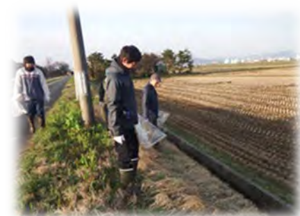
施設の点検・清掃活動