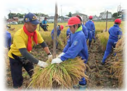
町内の小学校と連携し、 伝統的農法による農業体験を実施

今後も田んぼの保全活動に努めるほか、農業に関わったことのない子どもたちに、田んぼの大切さを理解してもらうための体験活動を続けていきたいと考えています。