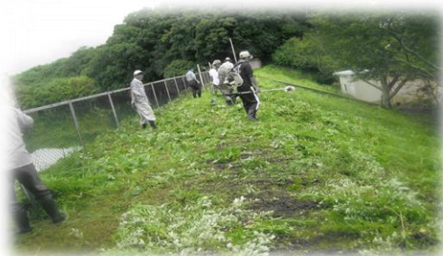
ため池堤体の草刈り作業