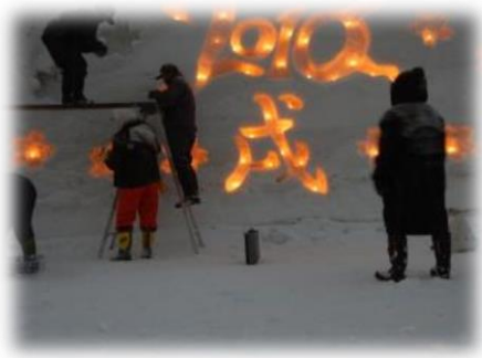
「雪あかり」での雪像の作成