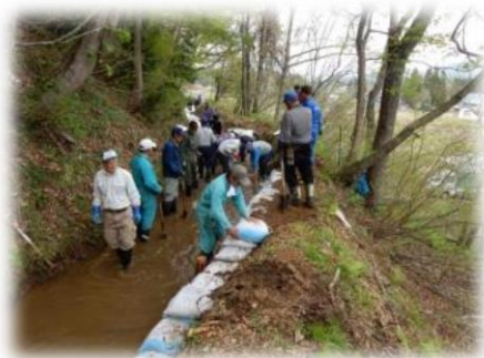
水路の崩壊箇所の補修