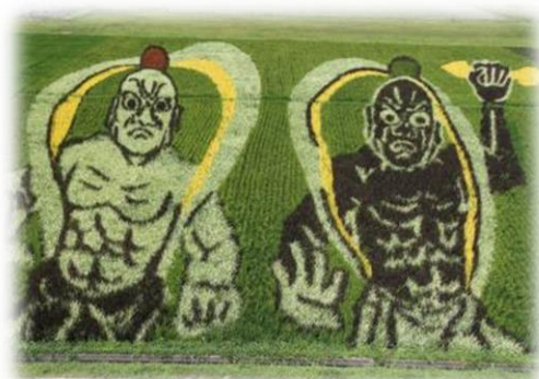
迫力のある田んぼアート