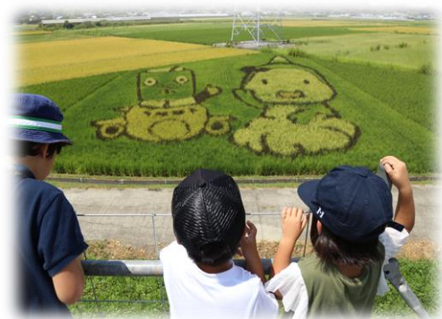
田んぼアートの鑑賞 (右：菊川市のキャラクター「きくのん」)