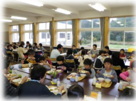
学校給食における交流