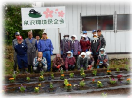
整備した花壇と保全会看板