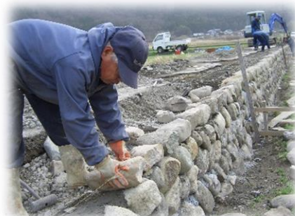
農道法面の石積の補修工事