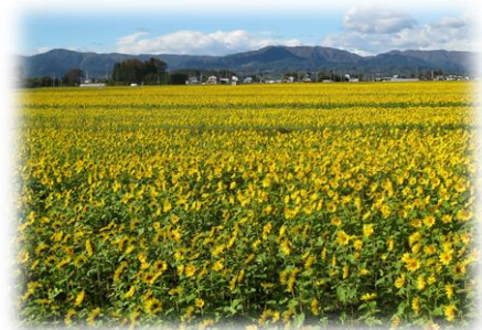
一面に咲くひまわり