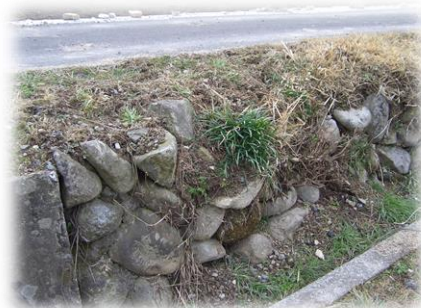
農道法面の石積の補修工事 (施工前)