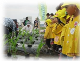
園児と福祉団体による苗の植え付け