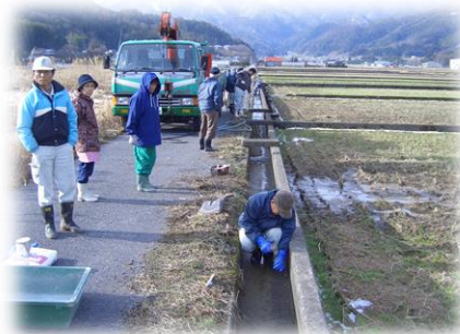
水路の目地補修の講習会