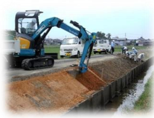
サポート隊による直営施工