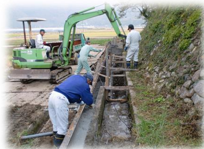
水路の破損部分の補修