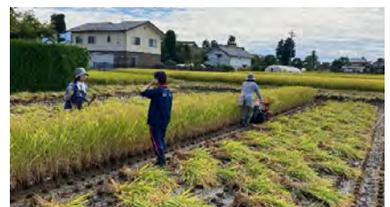
はぜがけの準備でイナゴを発見