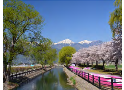
じっかせぎ 安曇野を代表する拾ヶ堰