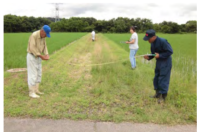
現地確認には女性が参加