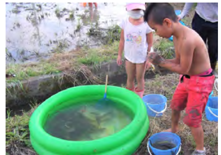
泥んこで田鯉を捕まえる