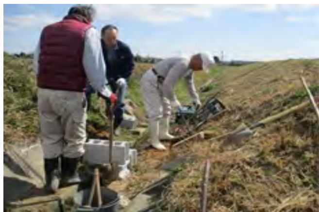
直営施工による水路法面階段の設置

また、地域住民ひとりひとりに声をかけることで、日頃会うことが少ない住民との交流が増えました。例えば、泥上げにひとり暮らしの高齢者を誘ったり、新規就農者が地域になじめるよう声をかけたりしています。