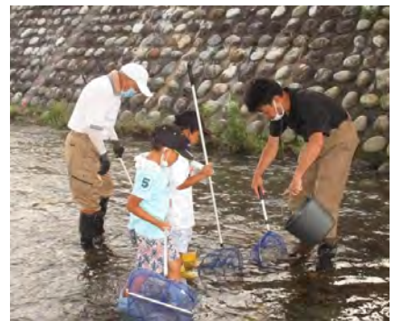
石に隠れた生き物を観察