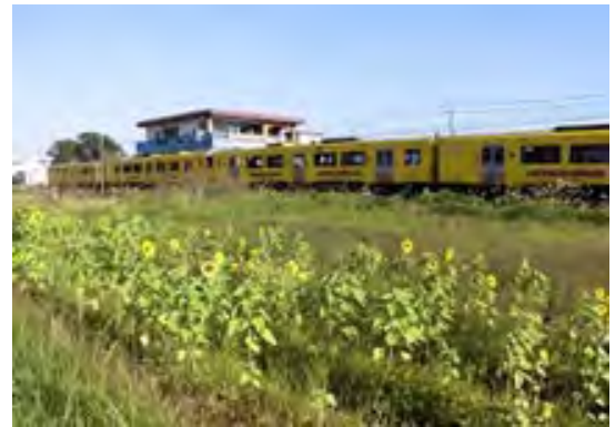
ひまわりによる景観形成