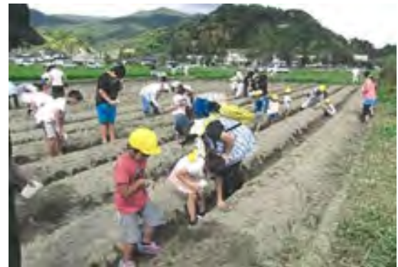
花植えによる景観形成