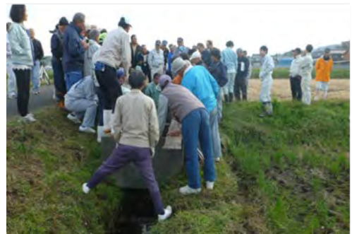
水路補修現地講習会

◎本地区は過去に河川氾濫に遭った歴史があり、地域の防災・減災意識の高まりにより、令和3年度から「雨水貯留機能の強化(田んぼダム)」の取組を始めており、組織の役員で排水調整板(板材)を自作して田んぼダムに取り組み農家に配布しながら、取組面積を拡大し、将来的には本地区で100%の取組を目指しています。