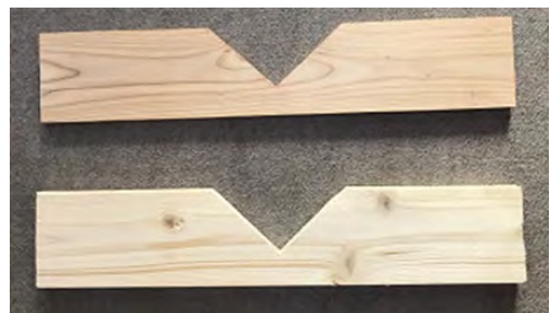
自作排水調整板 (W40×H10cm程度)