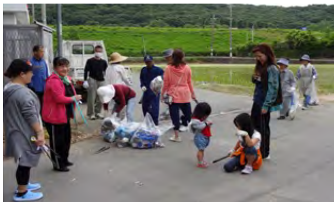
非農家を含めた地域住民が参加する クリーン作戦