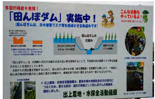
田んぼダム取組看板を設置してPR