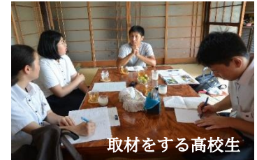
取材をする高校生