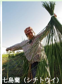
七島藪 (シチトウイ)

地域内には、15世紀からほとんどそのままの姿で現在に伝わる農村景観もある(左)。シチトウイは、い草より強健で耐久性に優れた畳表の材料で、現在は国東半島地域が国内唯一の産地(右)。