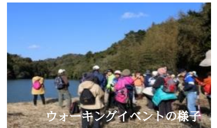
ウォーキングイベントの様子