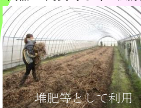
堆肥等として利用