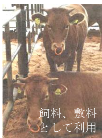
飼料、敷料として利用

刈草は牛馬の飼料、敷料のほか、堆肥として利用される。昔ながらの刈草の保存方法である「草小積み」は阿蘇の代表的な冬の風景。