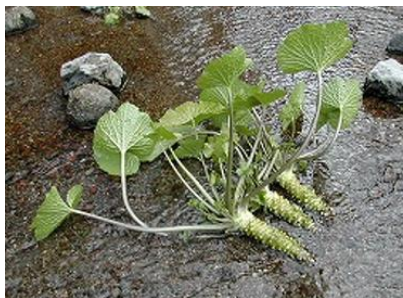
地域内の代表的な品種「真妻」

日本の固有種であるわさびを、沢を開墾して階段状に作ったわさび田で、肥料を極力使わず湧水に含まれる養分を利用して栽培する伝統的な農業を継承しています。