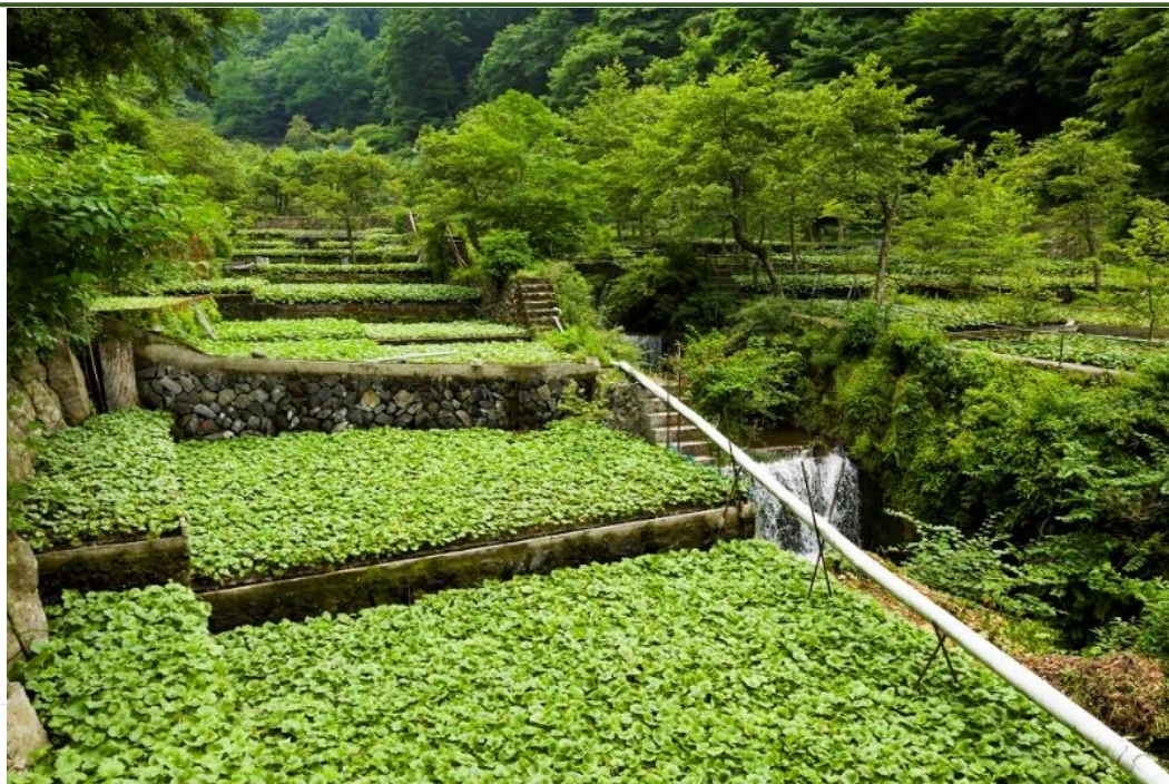
山間地に階段状に広がるわさび田

日本の固有種であるわさびを、沢を開墾して階段状に作ったわさび田で、肥料を極力使わず湧水に含まれる養分を利用して栽培する伝統的な農業を継承しています。