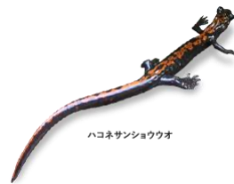
ハコネサンショウウオ

緩やかな水の流れは、ハコネサンショウウオなどの希少な生物に生息環境を提供しています。