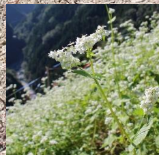
傾斜地で栽培される蕎麦

四国中央部の「にし阿波」(徳島県西部の山間部)では、段々畑のような水平面を形成せずに 傾斜地のまま農耕 し、敷き草(カヤ)を畑にすき込むことで土の流出を最小限に抑え、雑穀や伝統野菜、山菜、果樹を栽培してきました。