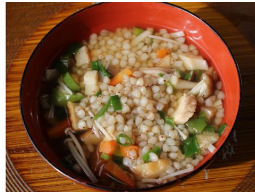
そばを粉にせず、実のままで食べる郷土食「そば米雑炊」