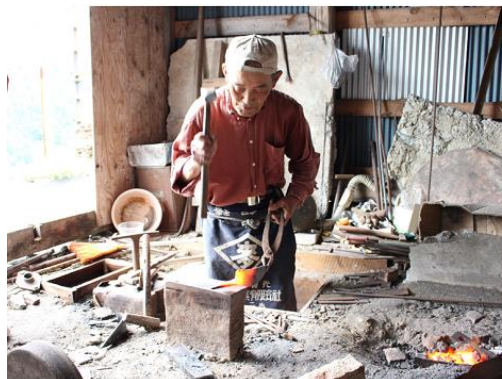
鍛冶による伝統農具製作の様子