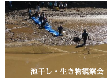
池干し・生き物観察会