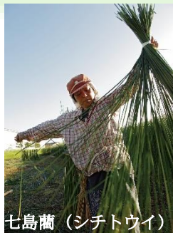
七島藪 (シチトウイ)

地域内には、15世紀からほとんどそのままの姿で現在に伝わる農村景観もある(左)。シチトウイは、い草より強健で耐久性に優れた畳表の材料で、現在は国東半島地域が国内唯一の産地(右)。