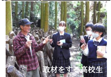
取材をする高校生