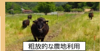
粗放的な農地利用