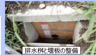
排水柵と堰板の整備