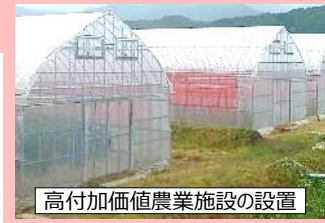
高付加価値農業施設の設置