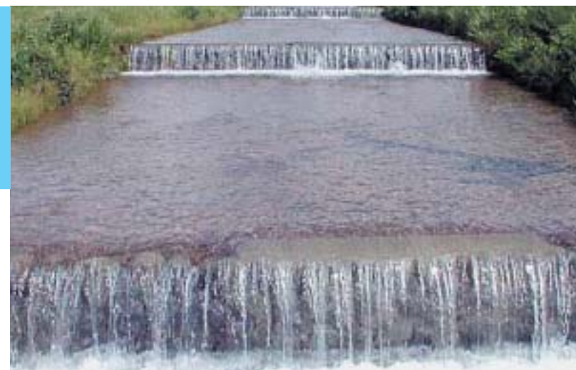
冷水害を克服する先人の知恵「温水路」