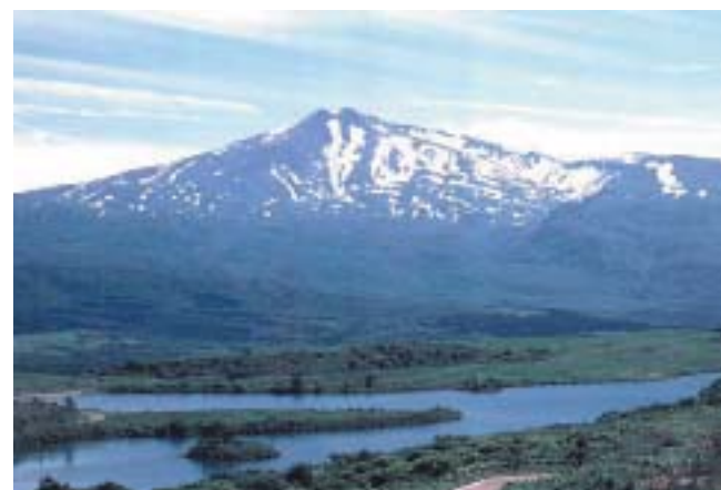
水源地鳥海山と仁賀保高原ため池群