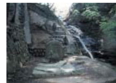
命を育む水の神「水神様」