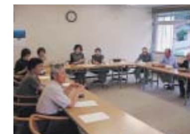
ワークショップによる構想づくり