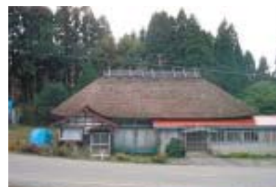
地域内に残る茅葺き民家