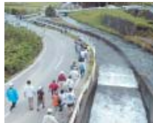
舟入川ウォーキング(高知県)