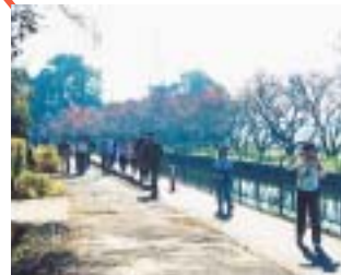
見沼代用水路クリーンウォーク(埼玉県)