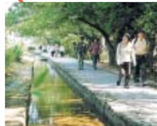
歩け運動「デンパークへ行こう」(明治用水)愛知県