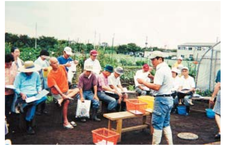
農家による講習風景(体験型市民農園)