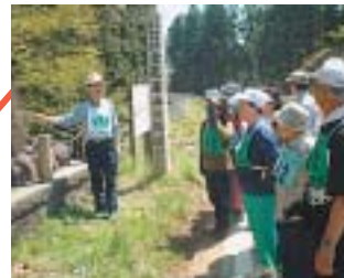
太素ウォーク2003(青森県)