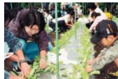
学校と家庭や地域が一体に取り組む体験学習