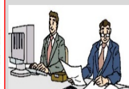
複式簿記に関する巡回指導