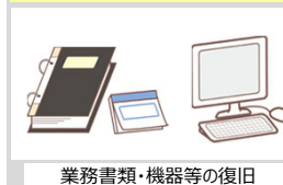
業務書類・機器等の復旧