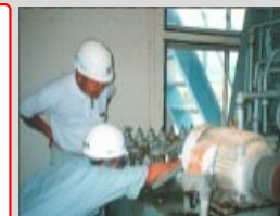
施設の診断・管理指導