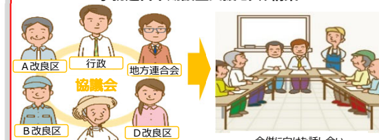
市町村単位での合併モデル構築