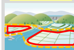
土地改良区の合併