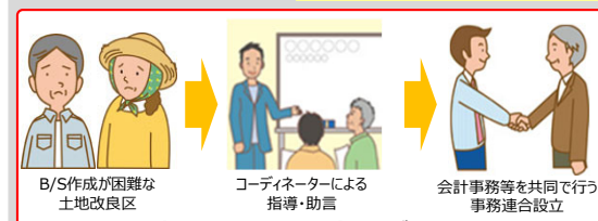
事務連合早期設立支援モデル構築