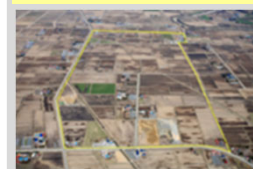
換地・担い手への農地集積