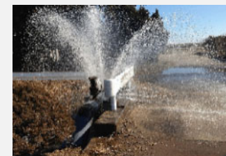
水管橋漏水部の補修