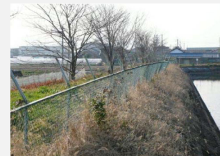
ネットフェンスの更新