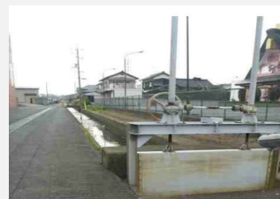
水門開閉の電動化