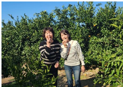
R6.11 南紀用水土地改良区視察研修（和歌山県）

また、候補者への要請は、土地改良区の役割や女性が参画する必要性等について、時間をかけて丁寧に説明するとともに、粘り強く協力を求めることも必要です。あわせて、最終的に家族の理解を得られることも大きなポイントになります。