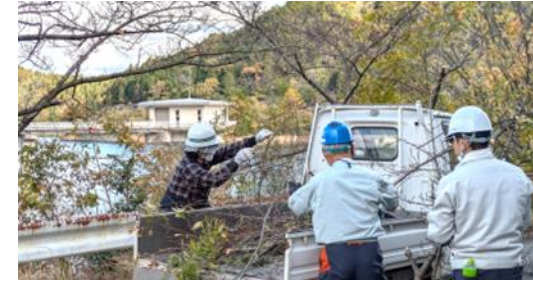
栲屋ダム周辺整備に参加

また、女性の強みでもあるコミュニケーション能力を発揮され、理事と事務局の距離が近くなりました。