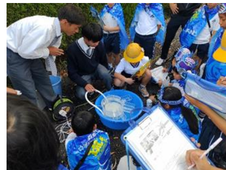
地域の高校生達と共に疏水の歴史を伝える

A. 初めは緊張すると思いますが、堅苦しく考えないで参加して欲しいです。 コミュニケーション能力の高さは女性の強みでもあり、色々なことにチャレンジしてみてください。 農業は景観を守ること、自分の住んでいる地域を守ることだと強く思います。 誰かがやらなければ維持できません。