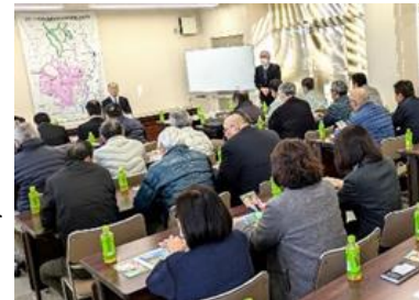
国政報告会を真剣に傾聴