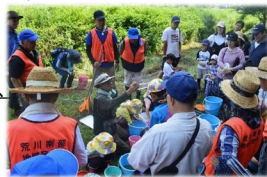
生き物調査の様子

検討の結果、多面的機能活動組織と連携の上、 田んぼの生き物調査やひまわりの植栽活動等のイベントを開催し、地域住民等の集客を図った上で、土地改良区の活動等について周知を行うなど、地道な活動を続けてきました。