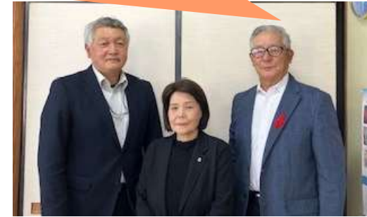
大仙市大曲土地改良区古谷事務局長（写真左）

定款変更の作業は簡単ではありませんでしたが、県の担当の方の指導を得ながら、無事変更することができました。