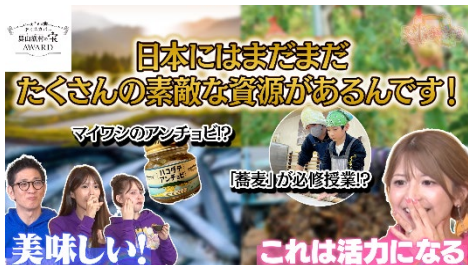
マスコミやYouTubeにて配信