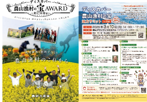
事例集や地域イベントによる情報発信