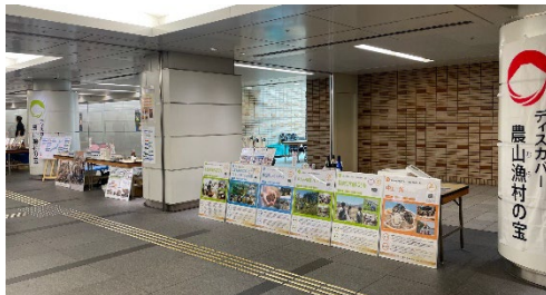
東京駅前の行幸地下通路で展示