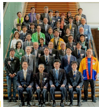
交流会での全体記念撮影