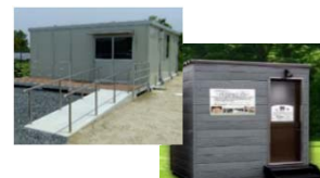
休憩所、トイレの整備