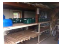
附帯施設 (農機具庫)