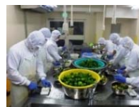
農産加工の実践研修