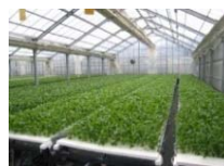
農業生産施設 (水耕栽培ハウス)