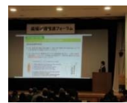
セミナー等の普及啓発