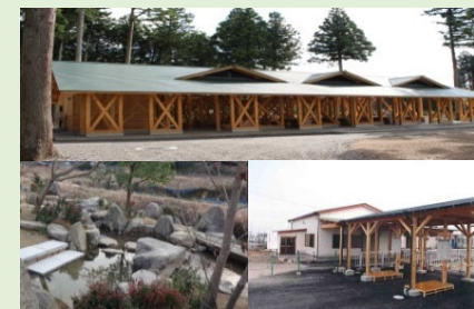
自然環境保全・活用施設

※計画主体は都道府県または市町村（農山漁村活性化法に基づく活性化計画の作成が必要）です。