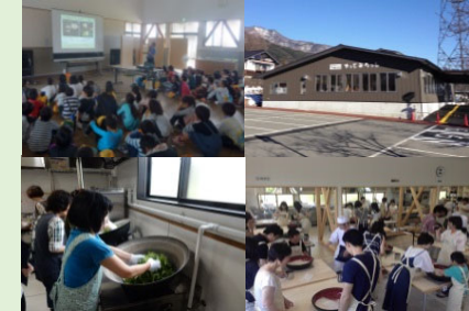
地域特産品の加工体験施設