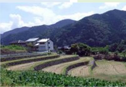
指定棚田地域の保全整備