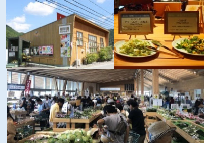
直売所・農家レストラン