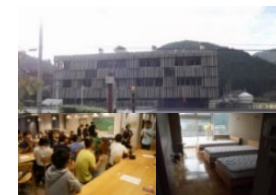
廃校を利用した交流施設