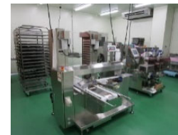
農林水産物処理加工施設