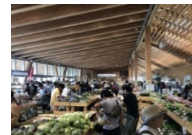
農林水産物直売所