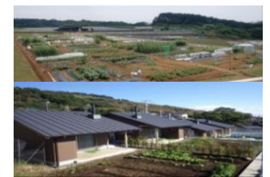
農作業の体験施設