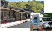
EV車等への給電設備