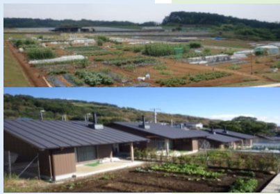
農作業の体験施設