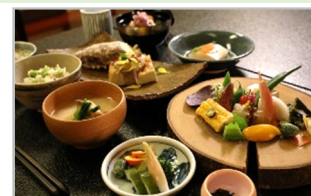
地元食材・景観等を活用した観光コンテンツの造成