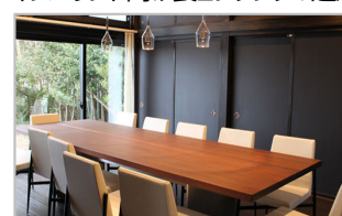
食の高付加価値化に不可欠な内装・遊休資産を活用した施設の整備