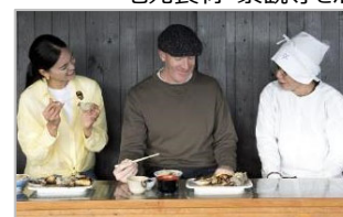
インバウンド向け食コンテンツの造成