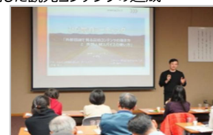
専門家の派遣・指導