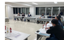
合意形成・計画づくり

住民意向調査、地域住民によるワークショップ開催 資源活用の推進体制・組織の整備、実施計画づくり 等