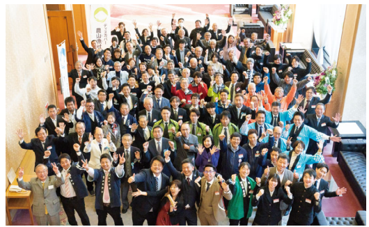
三田共用会議所において全体記念撮影 (選定証授与式：令和6年12月17日)