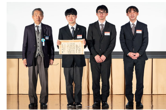
グランプリの贈呈