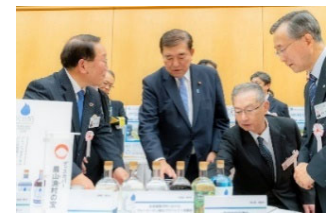
内閣総理大臣と選定地区の交流