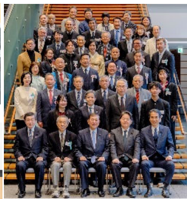
内閣総理大臣、内閣官房長官等と選定地区代表者で全体記念撮影 (交流会：令和7年1月7日)