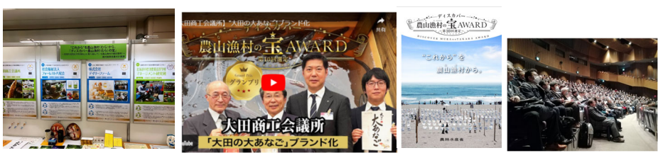
各種イベントにてPR YouTubeにて配信 事例集発行や地域イベントの開催