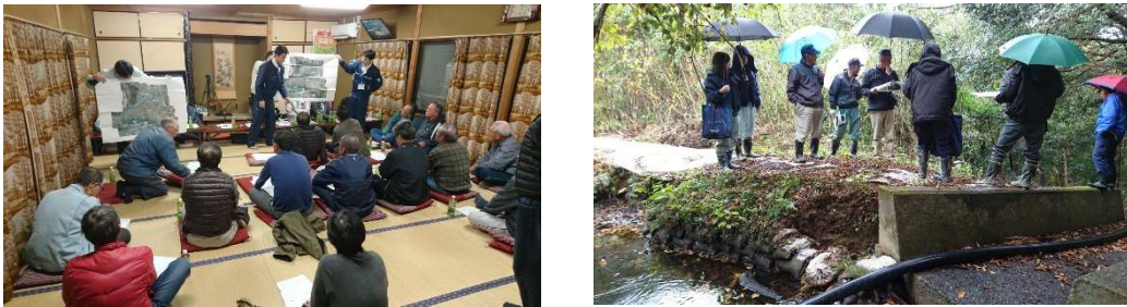
図 4-1 説明会の実施状況