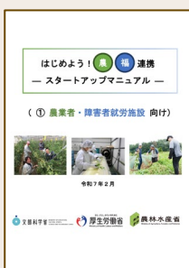
▲農福連携スタートアップマニュアル