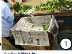
空き箱に新聞紙を敷く