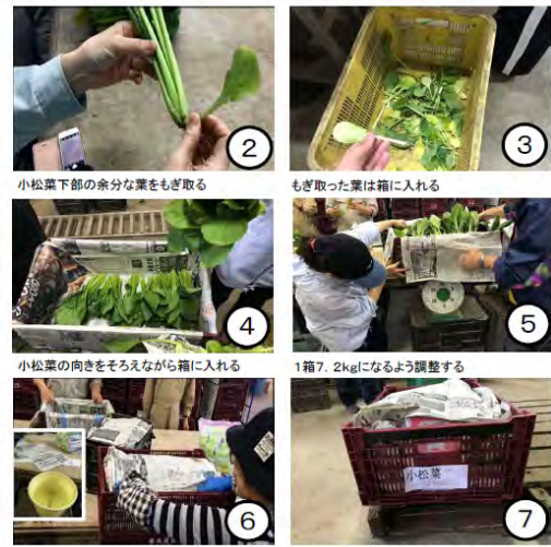
小松菜下部の余分な葉をもぎ取る