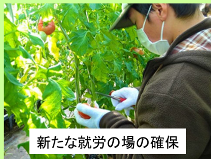
新たな就労の場の確保