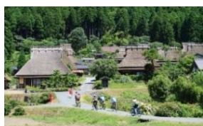
かやぶきの里北集落