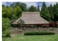
古民家宿泊施設「美十八」 (ニシオサプライズ)