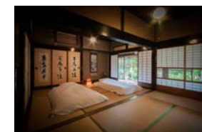
「美山FUTON&Breakfast」 ニシオサプライズ