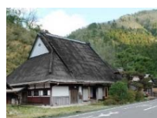
料理旅館 きぐすりや