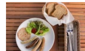
「美山おもしろ農民倶楽部」の無添加手造りハム・ソーセージ