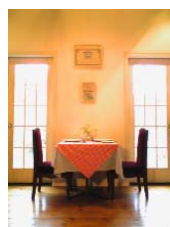
オーベルジュ ナカザワ